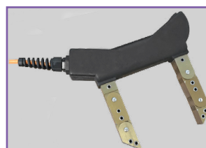
MTCN 230 BF